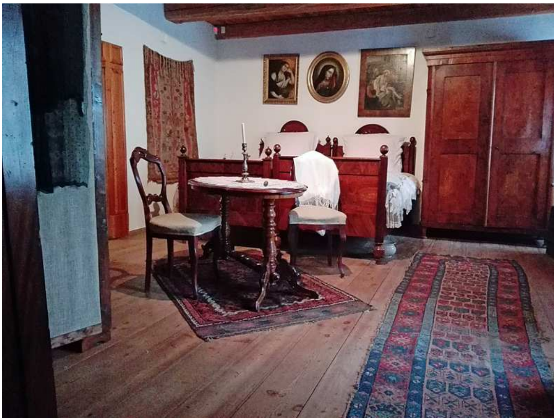
Zdj. 7. Dziewiętnastowieczne wnętrze mieszkalne w dworku szlacheckim z Pieczysk