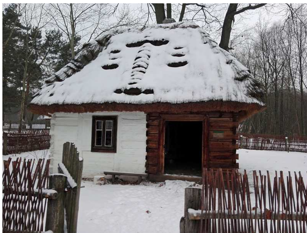
Zdj. 2. Muzeum Wsi Radomskiej, Dom ubożego chłopca