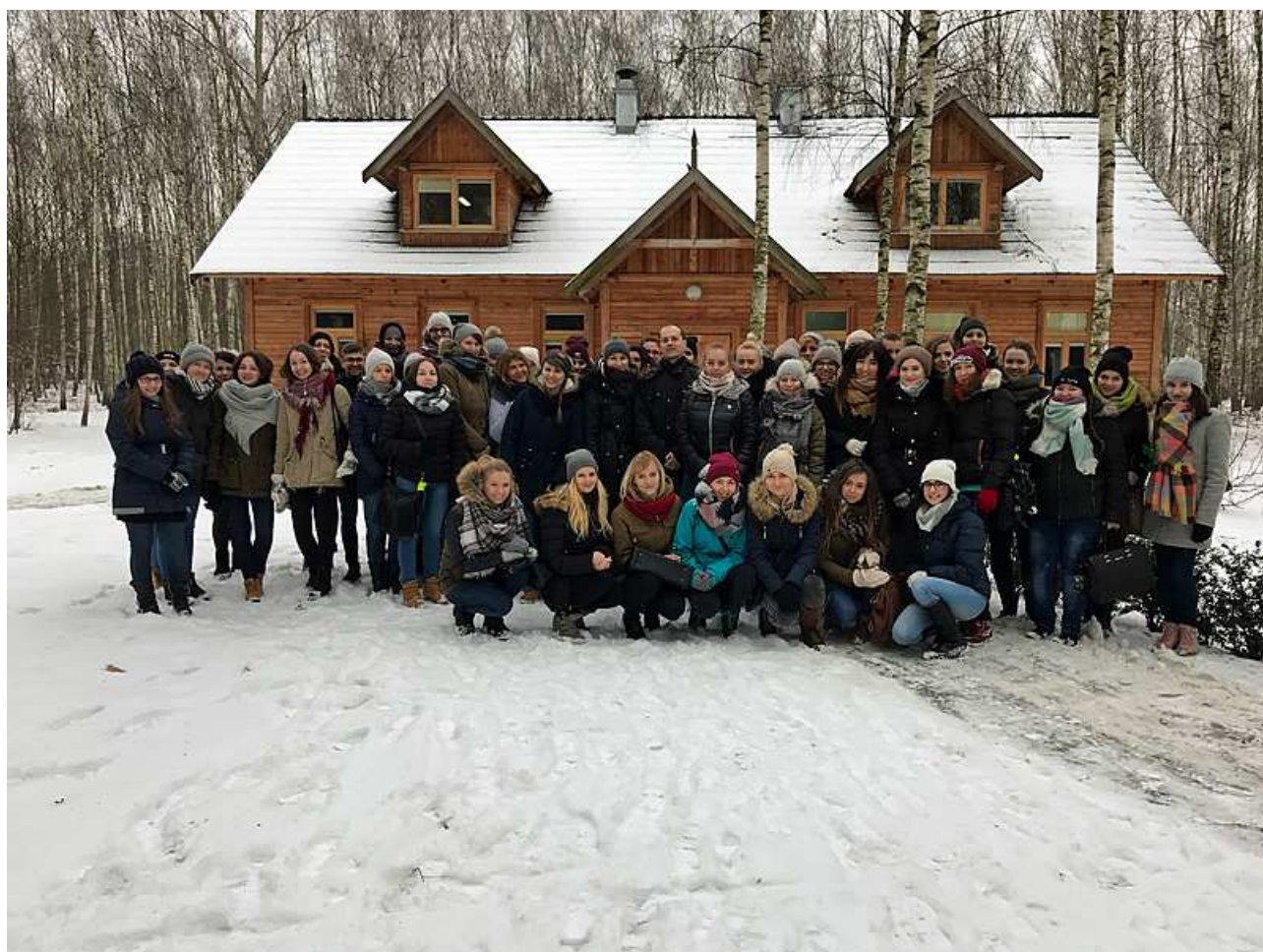
Zdj. 1. Studenci Pedagogiki, II stop., 1 rok, Muzeum Wsi Rad., 13.01.2017 r.