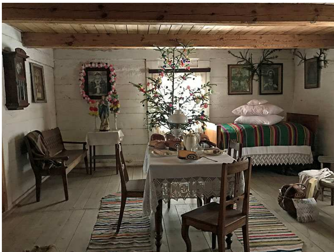
Zdj. 5. Muzeum Wsi Radomskiej, Wystrój chaty bogatego chłopca - Święta Bożego Narodzenia