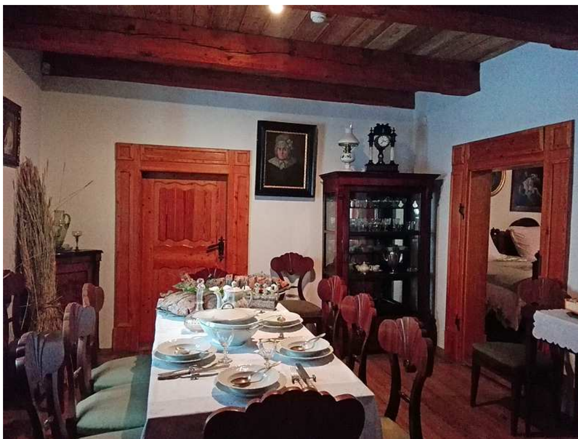
Zdj. 8. Zastawa stołowa, dworek szlachecki z Pieczysk wybudowany w XVIII w.