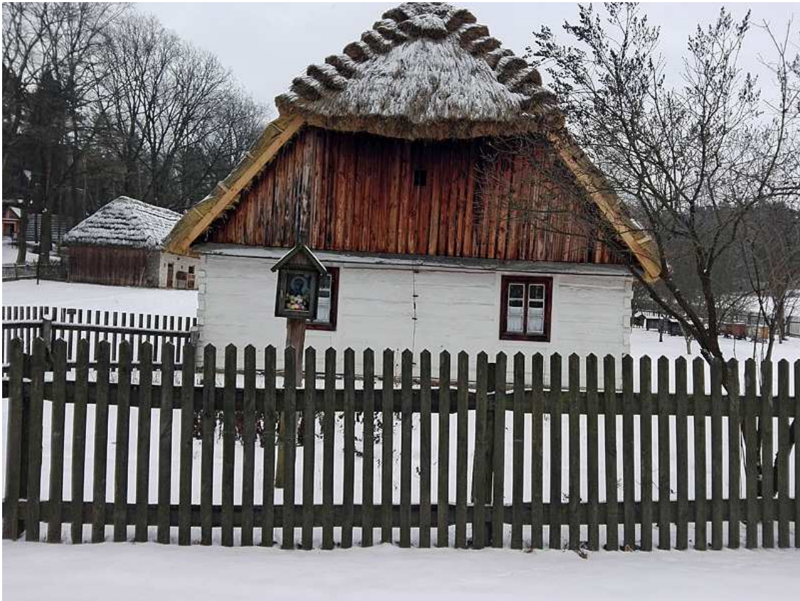
Zdj. 3. Muzeum Wsi Radomskiej, Zagroda chłopska