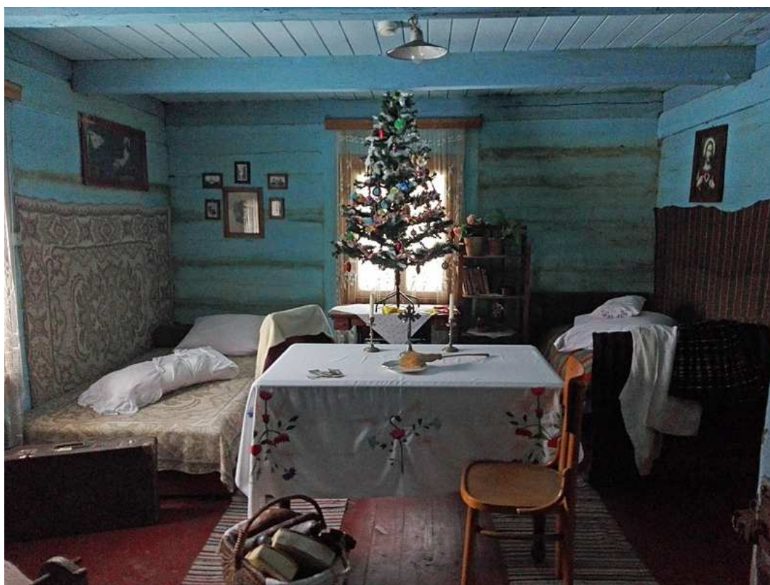
Zdj. 6. Muzeum Wsi Radomskiej, Wystrój chaty bogatego chłopca - Święta Bożego Narodzenia