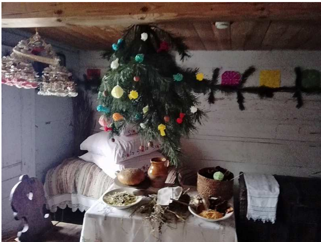
Zdj.4. Muzeum Wsi Radomskiej, Wystrój chaty ubogiego chłopa - Święta Bożego Narodzenia