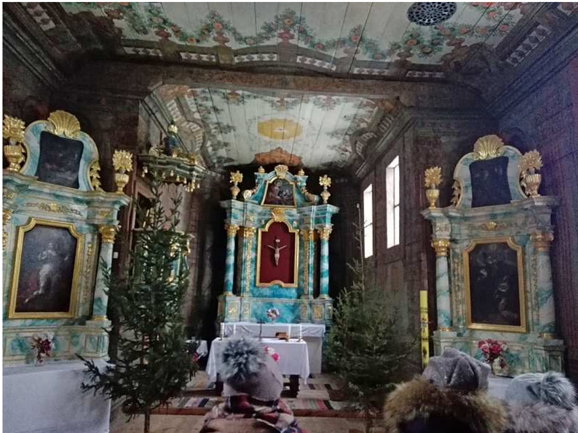
Zdj. 11. Późnobarokowy ołtarz w kościele z Wolanowa, 1749 r.