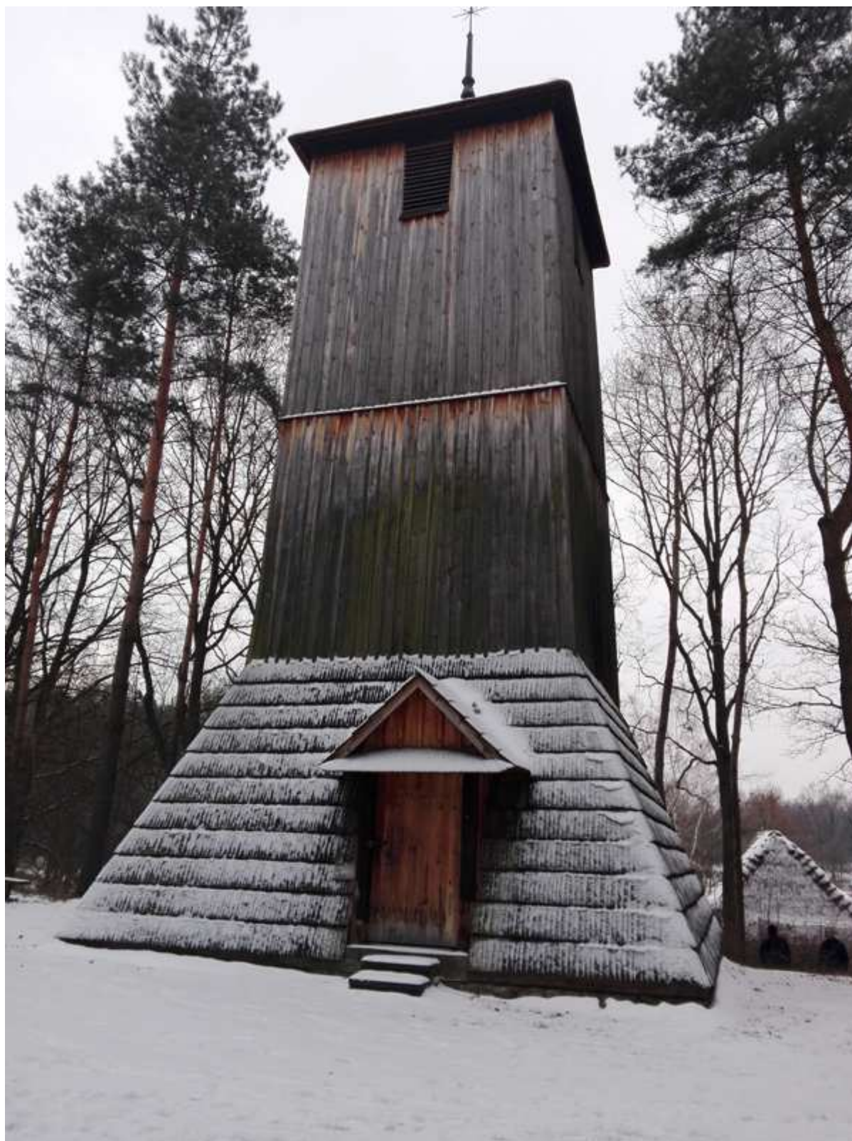
Zdj. 9. Dzwonnica z Wielgiego (zbudowana bez użycia gwoździ w 1880 r.)